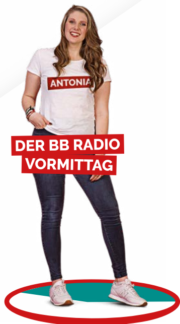
DER BB RADIO VORMITTAG