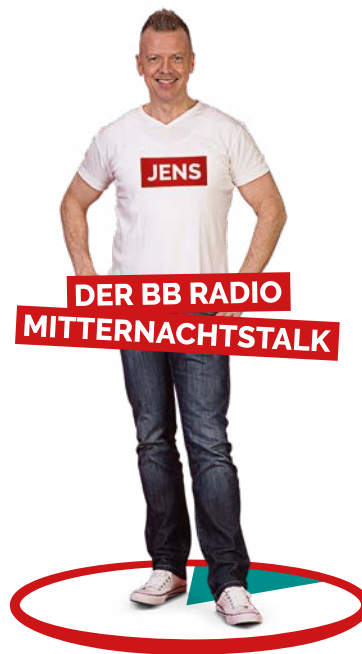
DER BB RADIO MITTERNACHTSTALK

Der Countdown in den Feierabend – die besten aktuellen Hits, minutengenaue Infos zu Staus im Feierabendverkehr und alle News des Tages, außerdem viele Gags zum Beispiel mit „Baumann und Clausen“ und „Die Besten Comedians Deutschlands“